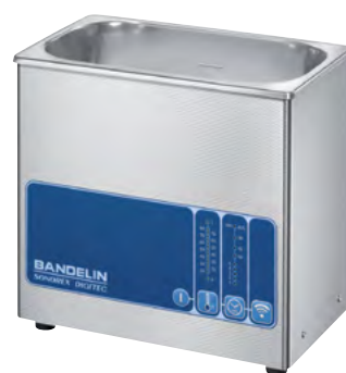
DT 100 H